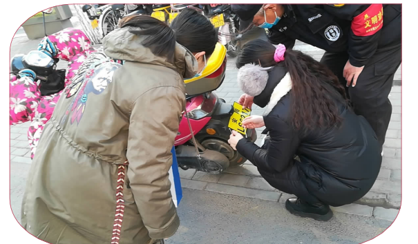
公司志愿者在妇幼保健院为无牌电动车上牌。