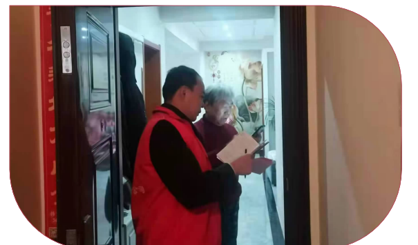
公司志愿者在宜居畅园开展文明入户宣传。