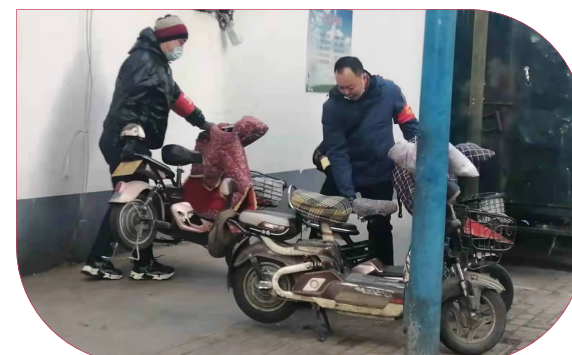
公司志愿者在摆放有序非机动车。