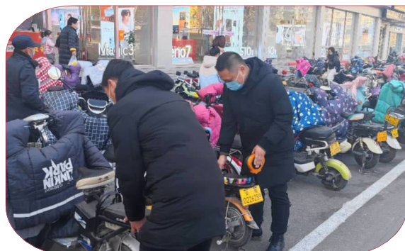
公司志愿者在红旗路摆放有序非机动车。